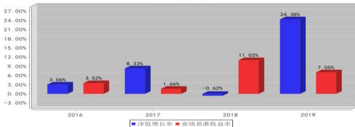
泰达宏利创益混合B基金每年净值增长率与同期业绩比较基准收益率的对比图(2019年12月31日)

注: 本基金 B 类份额合同生效日为 2016 年 1 月 25 日, 2016 年度净值增长率的计算期间为 2016 年 1 月 25 日至 2016 年 12 月 31 日。基金的过往业绩不代表未来表现。