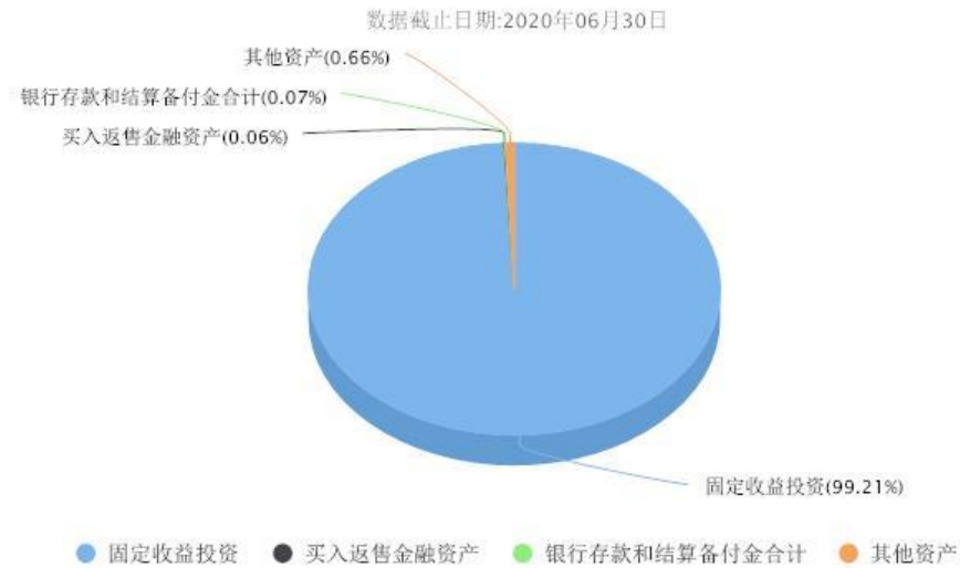
汇添富长添利定期开放债券C投资组合资产配置图表