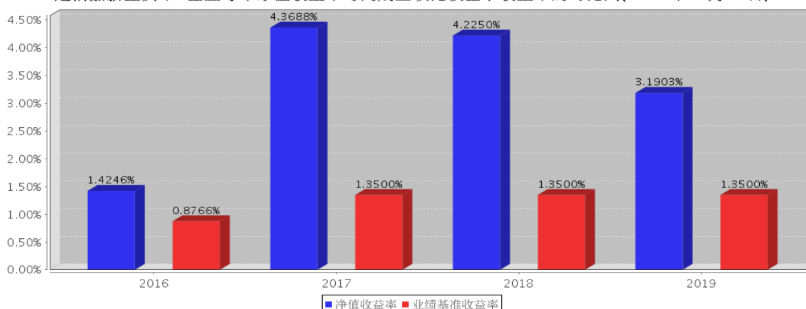
建信嘉薪宝货币B基金每年净值收益率与同期业绩比较基准收益率的对比图(2019年12月31日)