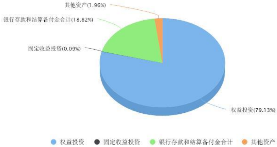
添富全球医疗混合(QDII)区域配置图表