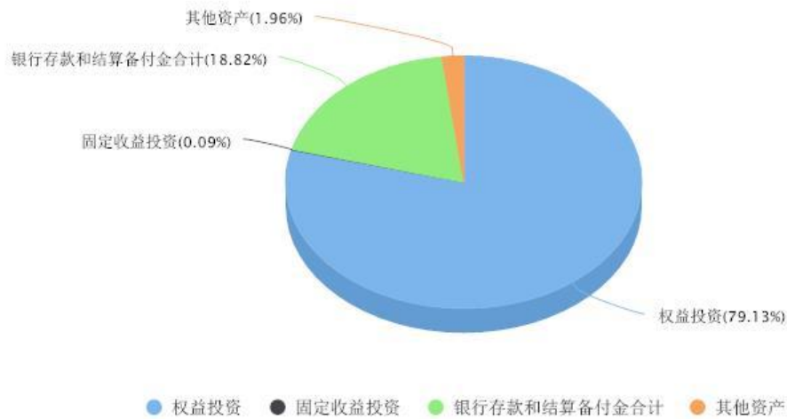
添富全球医疗混合(QDII)区域配置图表