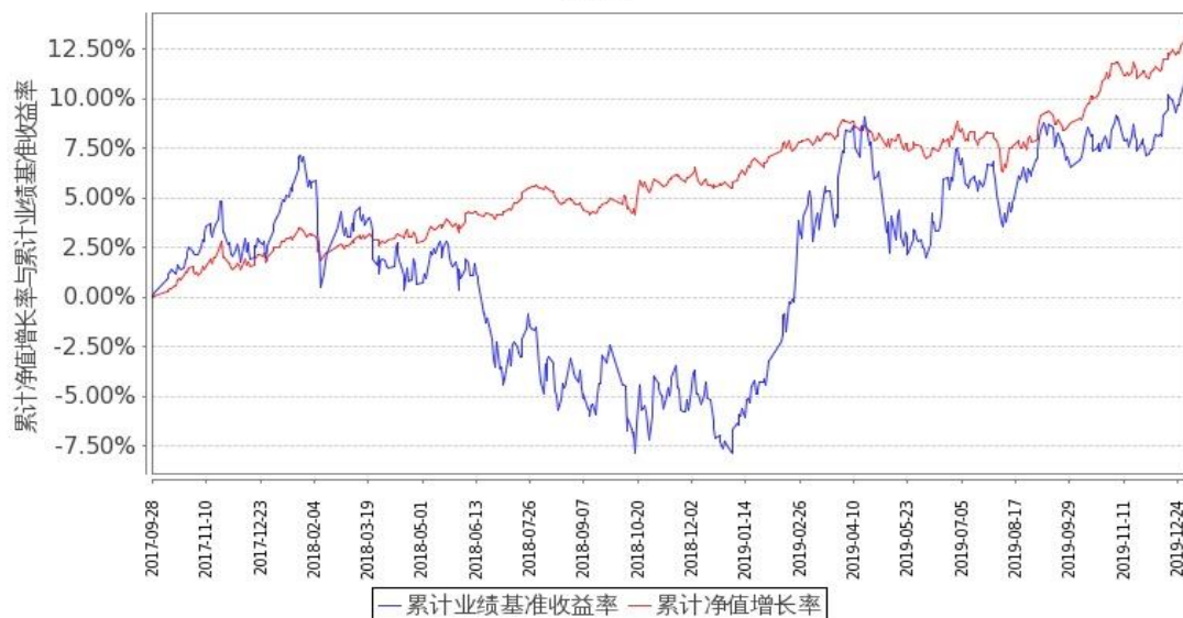
图 1：嘉实新添辉定期混合 A 基金份额累计净值增长率与同期业绩比较基准收益率的历史走势对比图