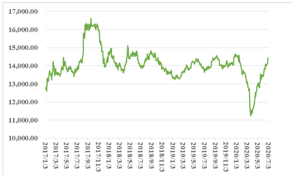
南海有色（灵通）金属铝锭现货价格趋势图 (2017 年 1 月-2020 年 6 月，单位：元/吨)

如上图所示，报告期内铝锭价格存在一定的波动性。公司采用以销定产的生产模式，较大程度上可以应对铝型材价格变动带来的影响。