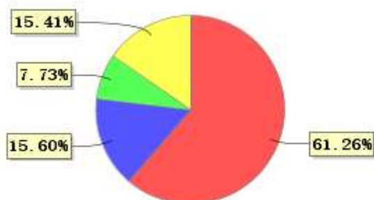
投资组合资产配置图表(2020年6月30日)

● 固定收益投资 ● 买入返售金融资产 ● 其他各项资产 ● 银行存款和结算备付金合计