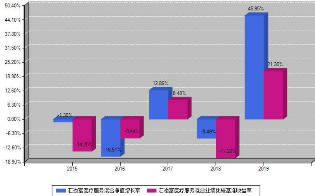
汇添富医疗服务混合每年净值增长率与同期业绩基准收益率对比图

注：基金的过往业绩不代表未来表现。本《基金合同》生效之日为2015年06月18日，合同生效当年按实际存续期计算，不按整个自然年度进行折算。