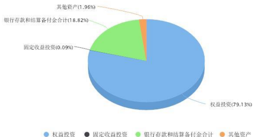
添富全球医疗混合(QDII)美元现钞区域配置图表