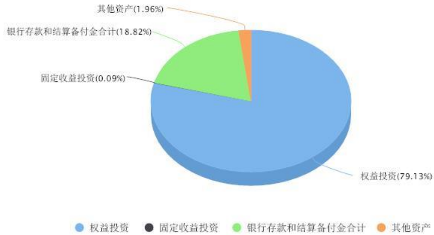
添富全球医疗混合(QDII)美元现汇区域配置图表