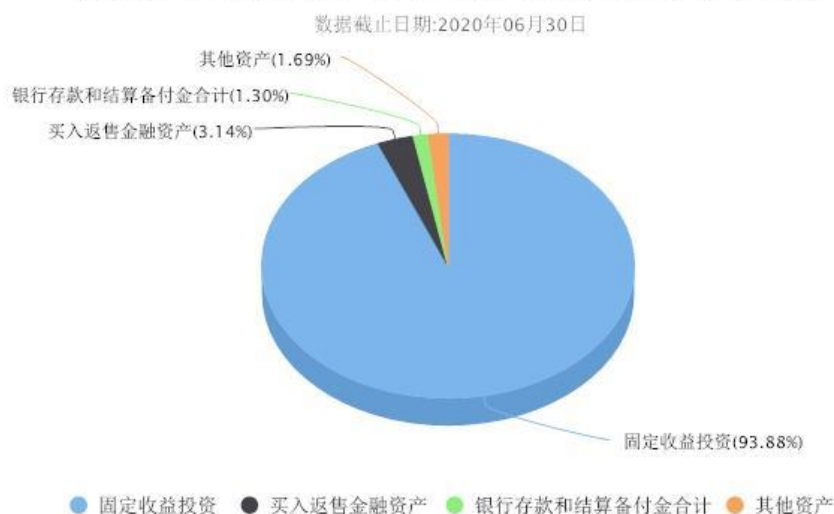
汇添富美元债债券(QDII)美元现汇A投资组合资产配置图表