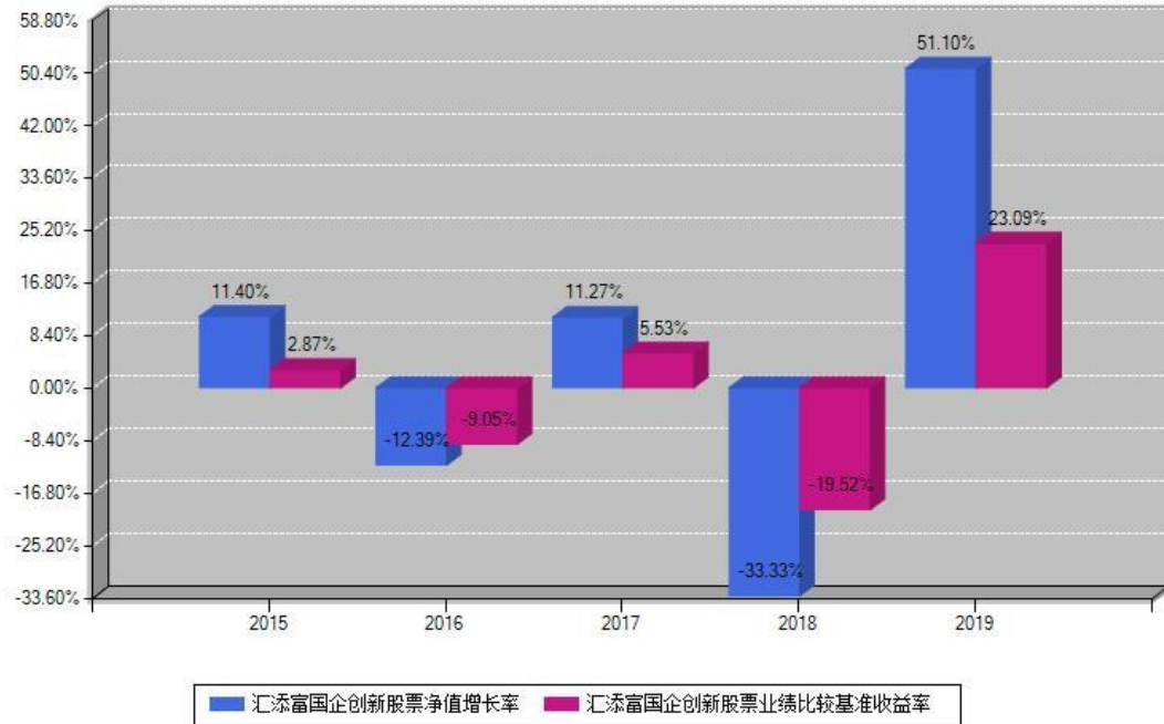
汇添富国企创新股票每年净值增长率与同期业绩基准收益率对比图

注：基金的过往业绩不代表未来表现。本《基金合同》生效之日为2015年07月10日，合同生效当年按实际存续期计算，不按整个自然年度进行折算。