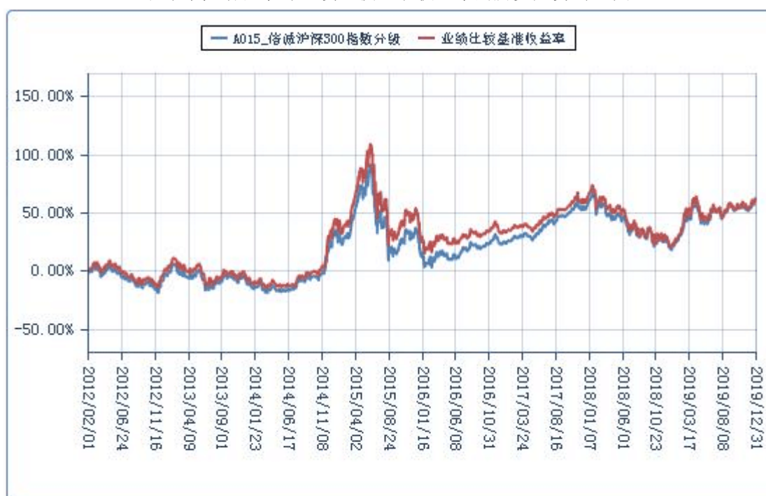
(二) 基金累计净值增长率与业绩比较基准收益率的历史走势对比图

注:本基金建仓日自 2012 年 2 月 1 日至 2012 年 8 月 1 日, 建仓期结束时资产配置比例符合本基金基金合同规定。