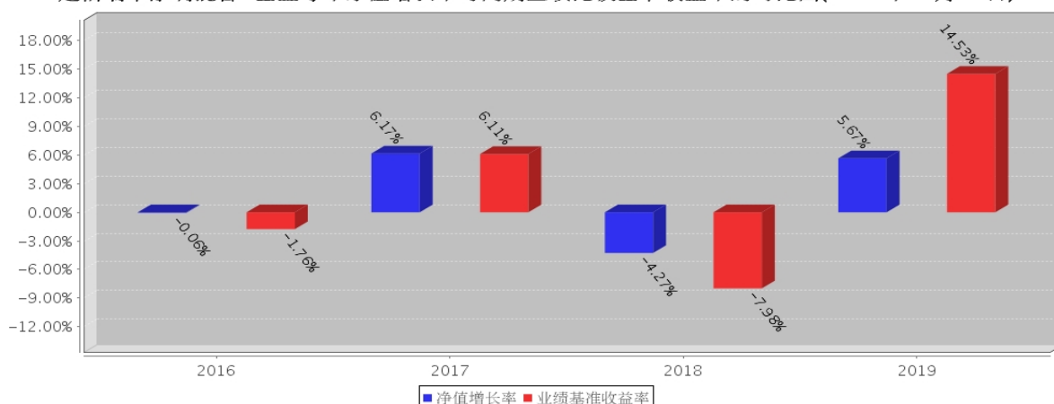
建信瑞丰添利混合C基金每年净值增长率与同期业绩比较基准收益率的对比图(2019年12月31日)