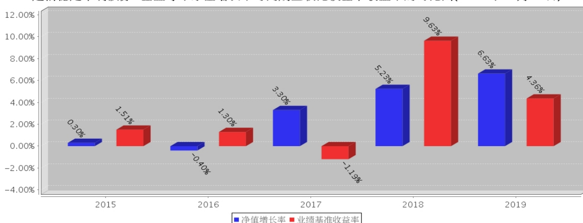
建信稳定丰利债券C基金每年净值增长率与同期业绩比较基准收益率的对比图(2019年12月31日)