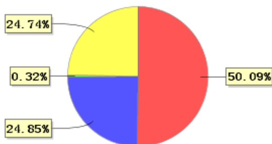
投资组合资产配置图表(2020年9月30日)

● 固定收益投资 ● 买入返售金融资产 ● 其他各项资产 ● 银行存款和结算备付金合计