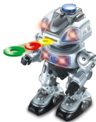
• 吐弹机器人 灵活移动，酷炫吐弹