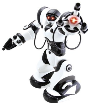
• 罗本艾特机器人 仿生人体，具备67个动作指令