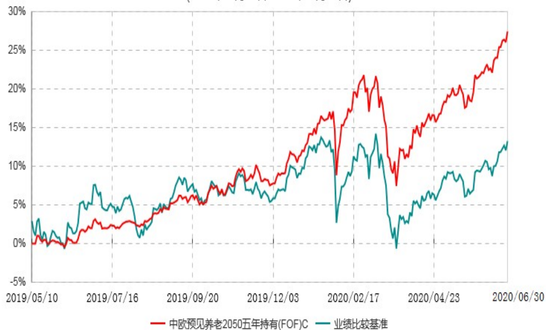
中欧预见养老2050五年持有(FOF)C累计净值增长率与业绩比较基准收益率历史走势对比图 (2019年05月10日-2020年06月30日)

注：本基金基金合同生效日期为2019年5月10日，按基金合同的规定，本基金自基金合同生效起六个月为建仓期，建仓期结束时各项资产配置比例已符合基金合同约定。