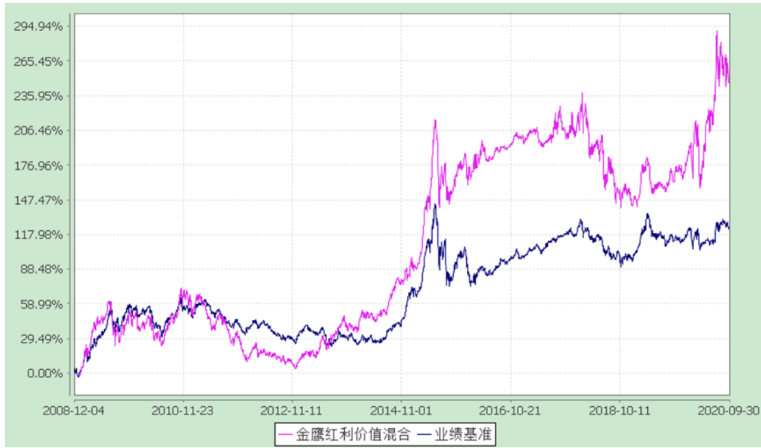
金鹰红利价值灵活配置混合型证券投资基金 累计净值增长率与业绩比较基准收益率历史走势对比图 (2008年12月4日至2020年9月30日)