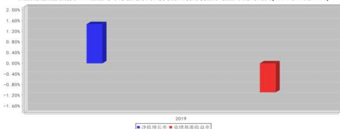
大成有色金属期货ETF基金每年净值增长率与同期业绩比较基准收益率的对比图(2019年12月31日)