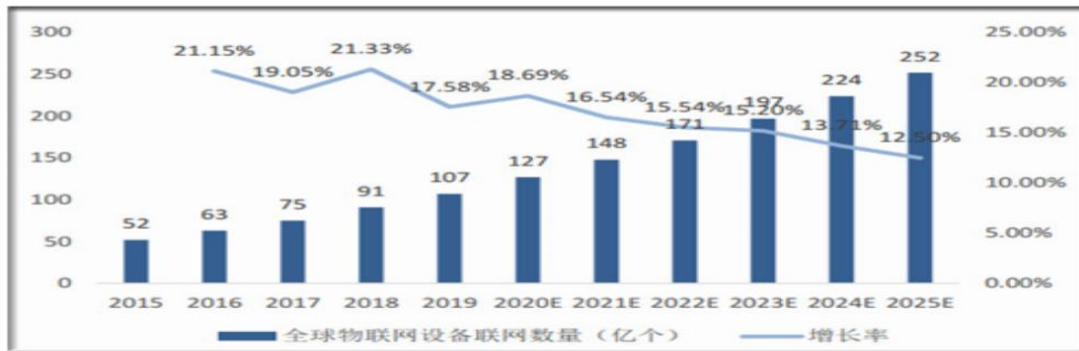
图表：全球物联网设备联网数量及增长率(单位：亿个，%)

此外，数据流量爆发为边缘云网技术注入新发展动力。随着云计算、5G、AI、VRAR 等新一代信息技术的发展与成熟，全球数据流量呈现持续增长态势，在 2016-2019 间，全球数据中心流量规模从每年 68ZB 增长至每年 14.1ZB，2021 年全球数据流量有望突破 20ZB。在亚太地区，云计算市场的增长直接拉动云数据流量提升，亚太云数据流量自 2016 年的 908ZB 增长至 2021 年将达到 3469EB。数据流量的爆发给云端储存数据带来挑战，边缘云网技术的发展在帮助云端储存计算数据中作用凸显，数据流量爆发将成为边缘云网市场进一步发展的新契机。。