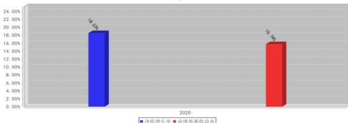
泰达养老2040三年持有混合FOF E基金每年净值增长率与同期业绩比较基准收益率的对比图(2020年12月31日)

注: 本基金合同生效日为 2020 年 2 月 27 日, 2020 年度净值增长率的计算期间为 2020 年 2 月 27 日至 2020 年 12 月 31 日。基金的过往业绩不代表未来表现。