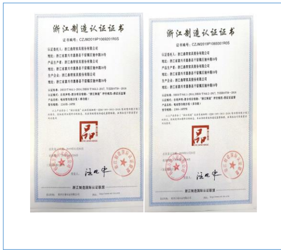
2020年12月31日，公司取得“浙江制造”认证证书两项。