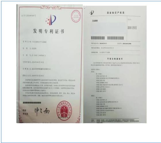
2020年12月7日，公司取得发明专利一项