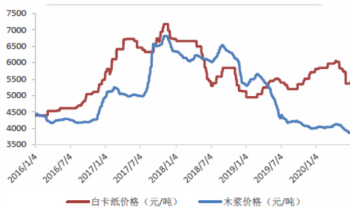
图：白卡纸与木浆价格趋势

报告期内，粤华包主要从事高端白卡纸相关产品的制造销售，其白卡纸业务单位售价与单位成本的具体构成如下：