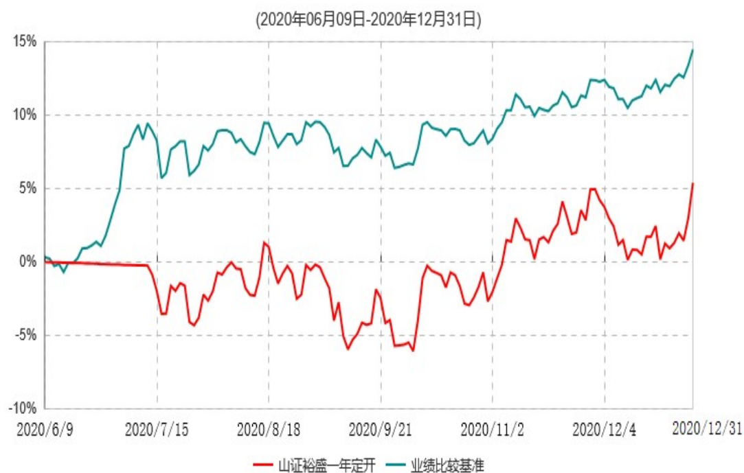
山西证券裕盛一年定期开放灵活配置混合型发起式证券投资基金累计净值增长率与业绩比较基准收益率历史走势对比图