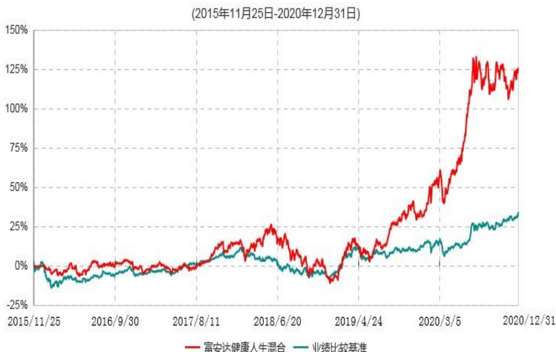
富安达健康人生灵活配置混合型证券投资基金累计净值增长率与业绩比较基准收益率历史走势对比图