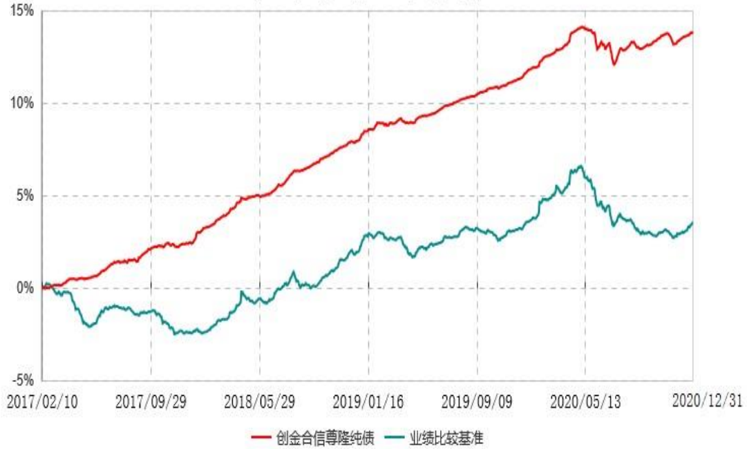
创金合信尊隆纯债债券型证券投资基金累计净值增长率与业绩比较基准收益率历史走势对比图 (2017年02月10日-2020年12月31日)