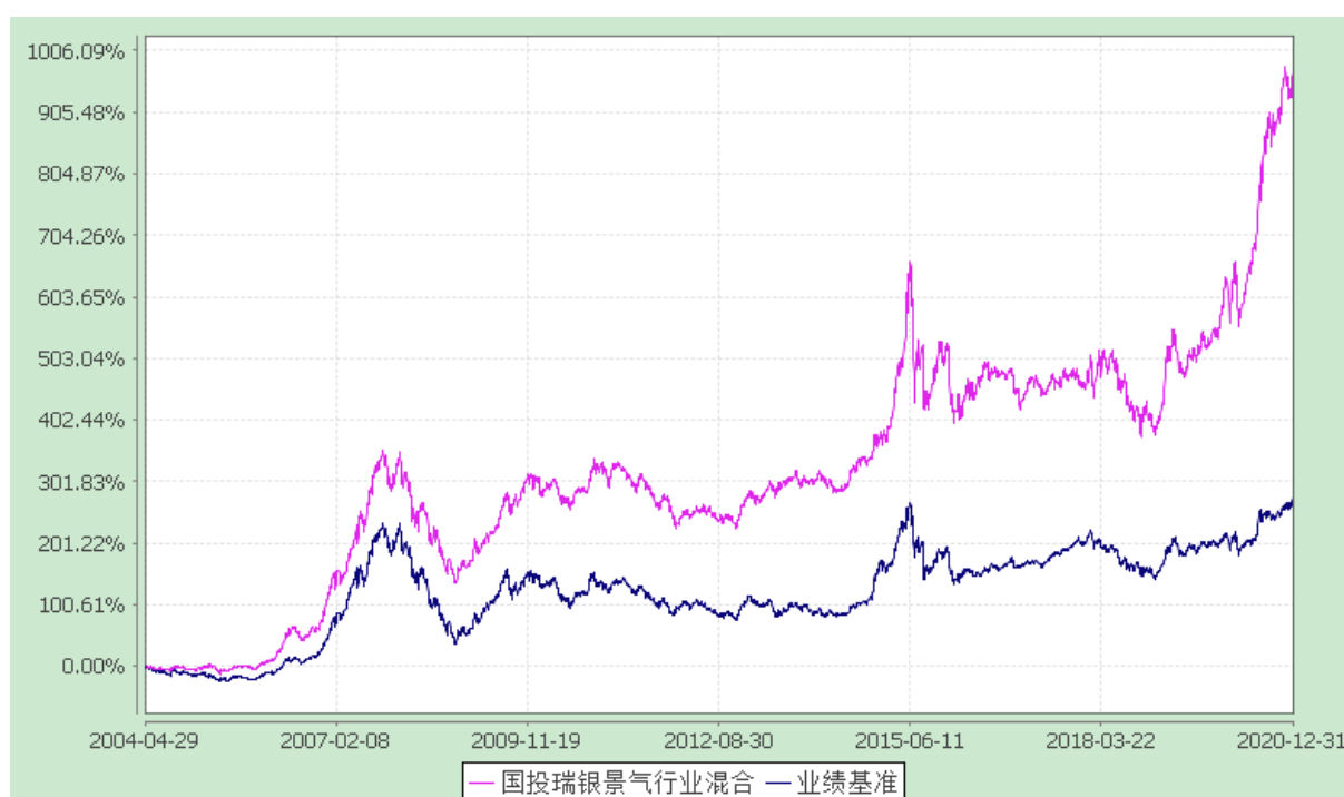
国投瑞银景气行业证券投资基金 份额累计净值增长率与业绩比较基准收益率的历史走势对比图 (2004 年 4 月 29 日至 2020 年 12 月 31 日)

注：本基金建仓期为自基金合同生效日起的六个月。截至建仓期结束，本基金各项资产配置比例符合基金合同及招募说明书有关投资比例的约定。