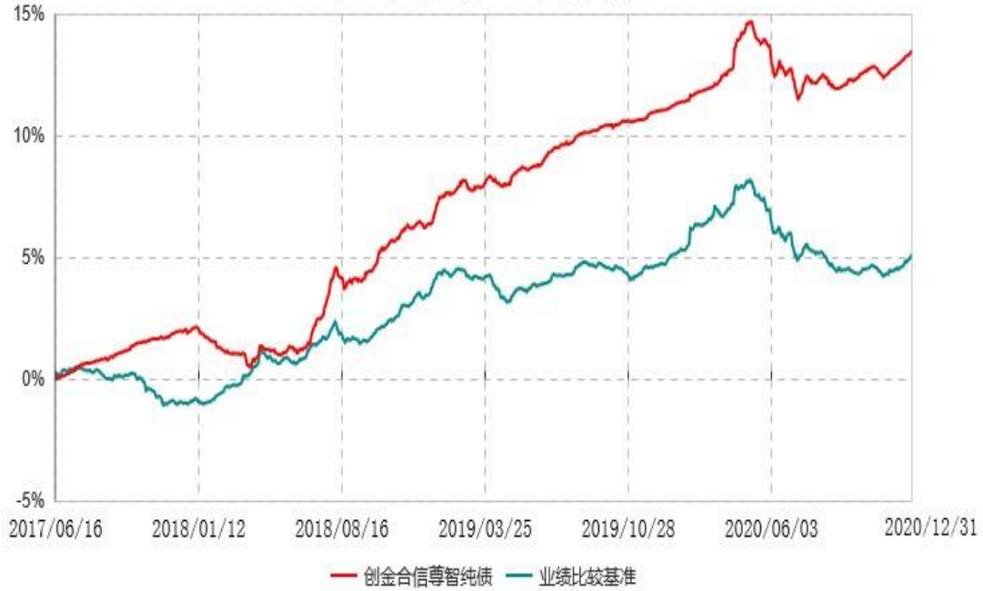
创金合信尊智纯债债券型证券投资基金累计净值增长率与业绩比较基准收益率历史走势对比图 (2017年06月16日-2020年12月31日)