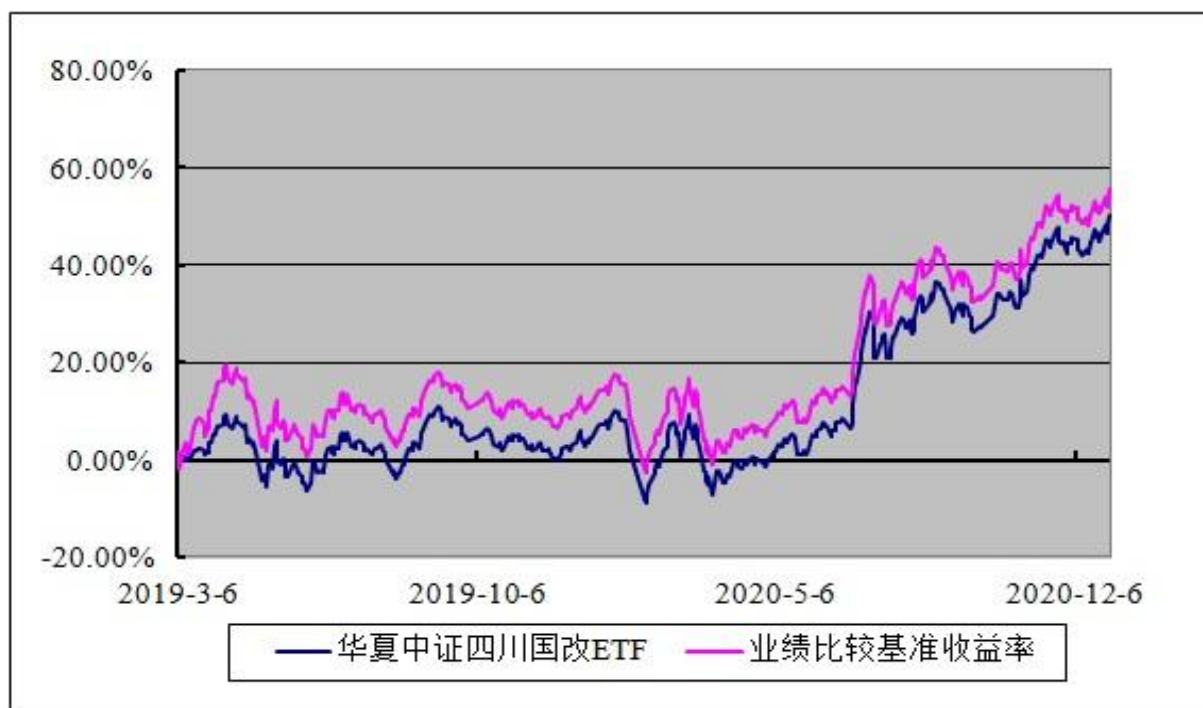
华夏中证四川国企改革交易型开放式指数证券投资基金 基金份额累计净值增长率与业绩比较基准收益率的历史走势对比图 (2019年3月6日至2020年12月31日)