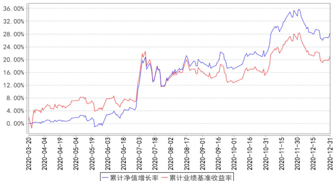
股息龙头累计净值增长率与同期业绩比较基准收益率的历史走势对比图

注：1、本基金基金合同于 2020 年 03 月 20 日生效，截至本报告期末本基金基金合同生效未满一年。2、截至建仓期结束，本基金的各项投资比例已达到基金合同中规定的各项比例