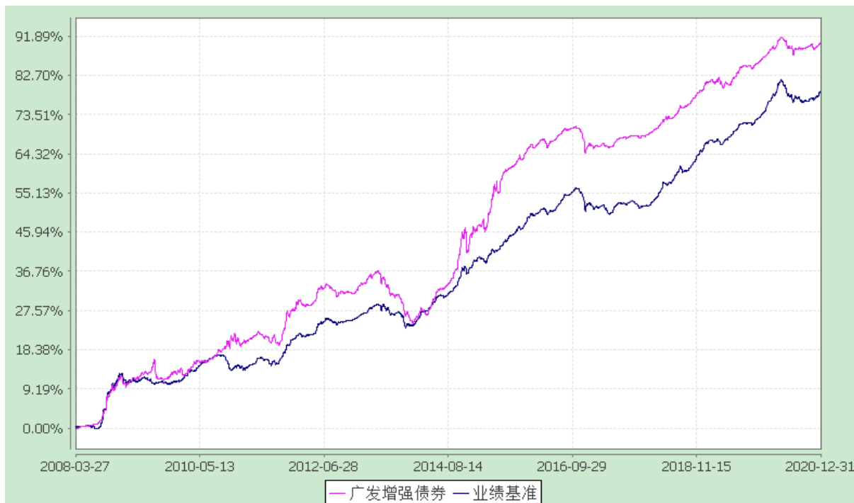
份额累计净值增长率与业绩比较基准收益率的历史走势对比图 (2008 年 3 月 27 日至 2020 年 12 月 31 日)