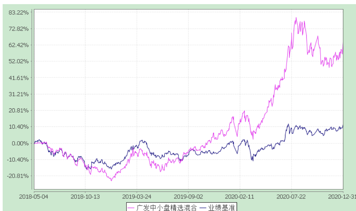
广发中小盘精选混合型证券投资基金 份额累计净值增长率与业绩比较基准收益率的历史走势对比图 (2018年5月4日至2020年12月31日)