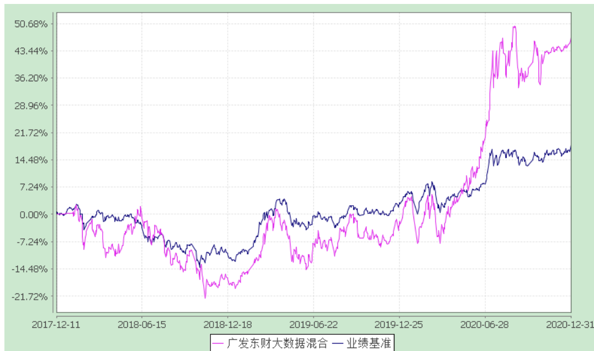
广发东财大数据精选灵活配置混合型证券投资基金 份额累计净值增长率与业绩比较基准收益率的历史走势对比图 (2017 年 12 月 11 日至 2020 年 12 月 31 日)