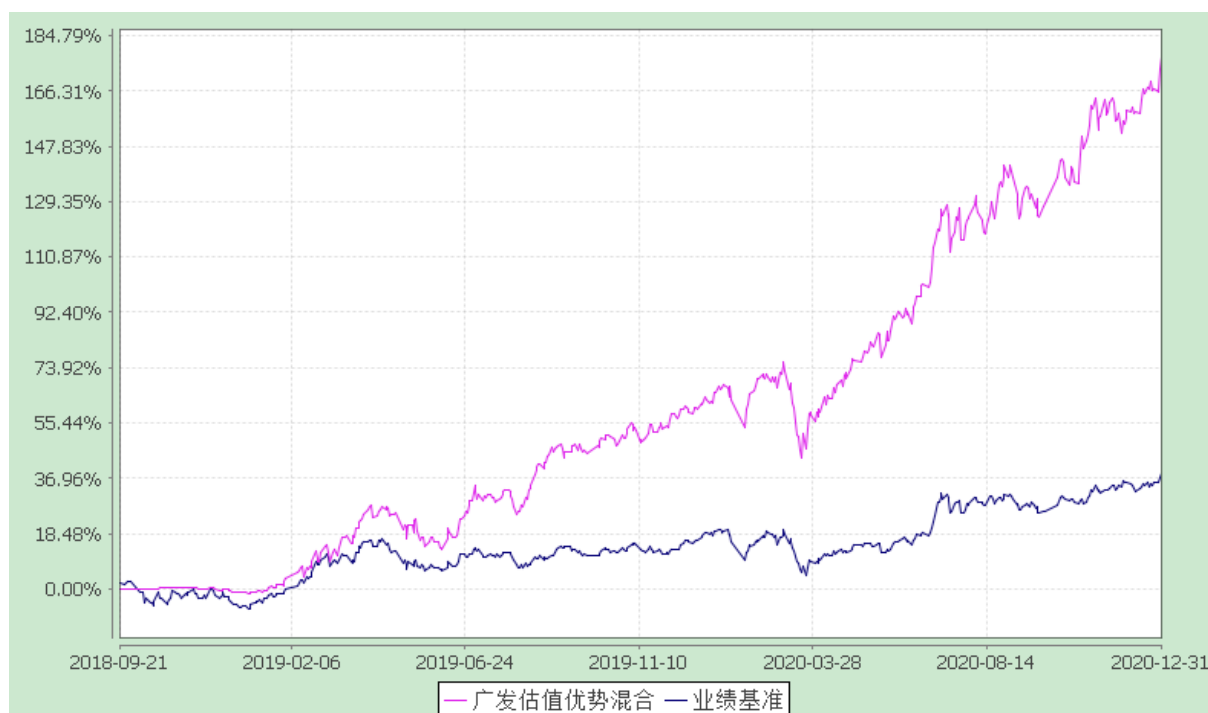
广发估值优势混合型证券投资基金 份额累计净值增长率与业绩比较基准收益率的历史走势对比图 (2018 年 9 月 21 日至 2020 年 12 月 31 日)