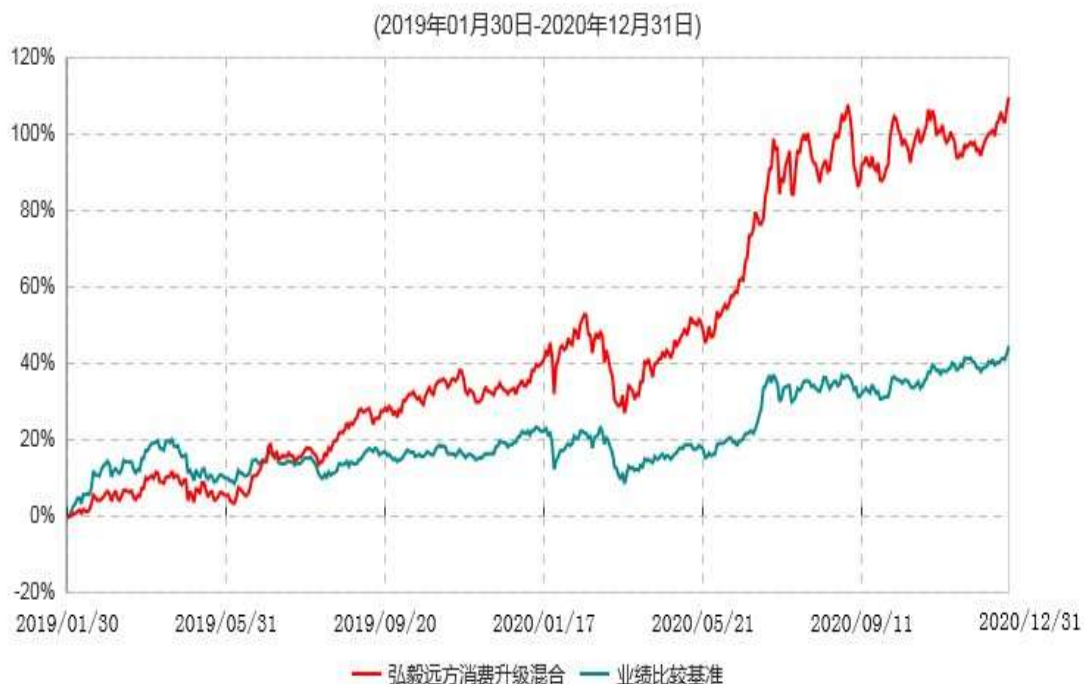
弘毅远方消费升级混合型发起式证券投资基金累计净值增长率与业绩比较基准收益率历史走势对比图

注：本基金基金合同生效日为2019年1月30日。截至建仓期结束，本基金各项资产配置比例符合基金合同及招募说明书有关投资比例的约定。