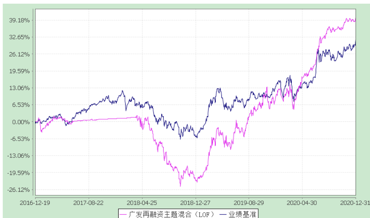
广发再融资主题灵活配置混合型证券投资基金（LOF） 份额累计净值增长率与业绩比较基准收益率的历史走势对比图 (2016 年 12 月 19 日至 2020 年 12 月 31 日)