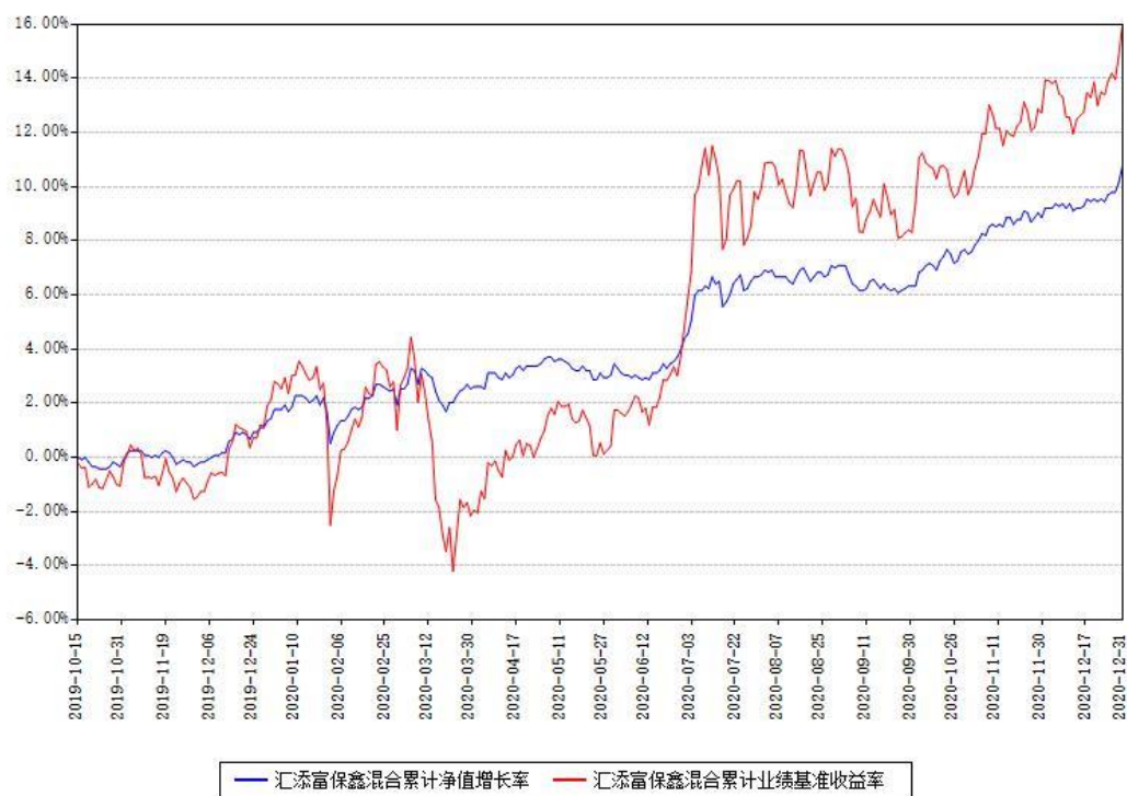
汇添富保鑫混合累计净值增长率与同期业绩基准收益率对比图

注：本基金建仓期为本《基金合同》生效之日（2019年10月15日）起6个月，建仓期结束时各项资产配置比例符合合同约定。