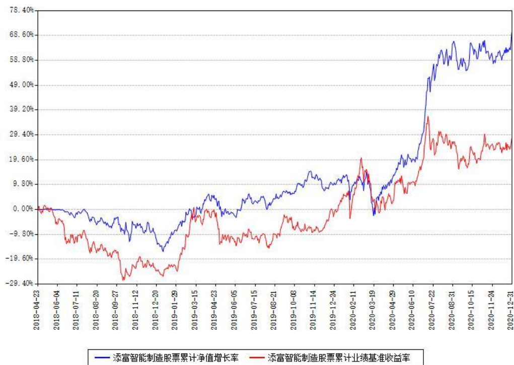
添富智能制造股票累计净值增长率与同期业绩基准收益率对比图

注：本基金建仓期为本《基金合同》生效之日（2018年04月23日）起6个月，建仓期结束时各项资产配置比例符合合同约定。