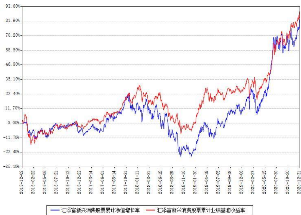
汇添富新兴消费股票累计净值增长率与同期业绩基准收益率对比图

注：本基金建仓期为本《基金合同》生效之日（2015年12月02日）起6个月，建仓期结束时各项资产配置比例符合合同约定。