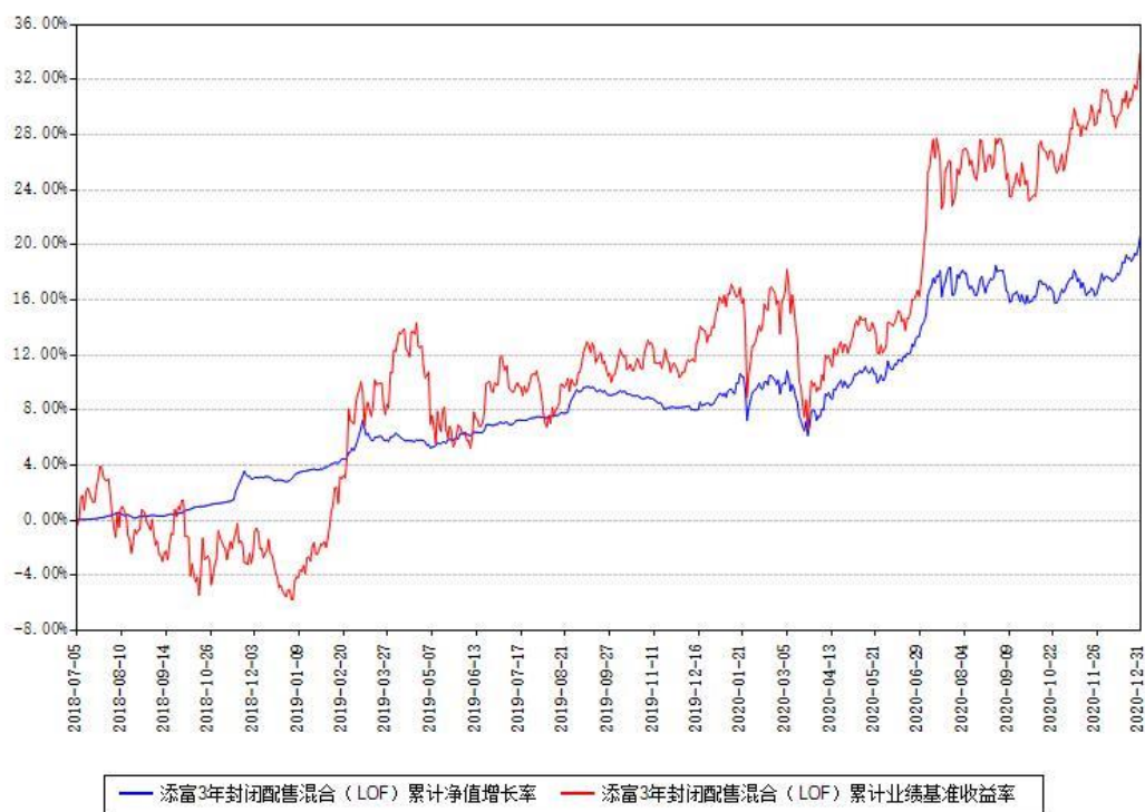
添富3年封闭配售混合（LOF）累计净值增长率与同期业绩基准收益率对比图

注：本基金建仓期为本《基金合同》生效之日（2018年07月05日）起6个月，建仓期结束时各项资产配置比例符合合同约定。