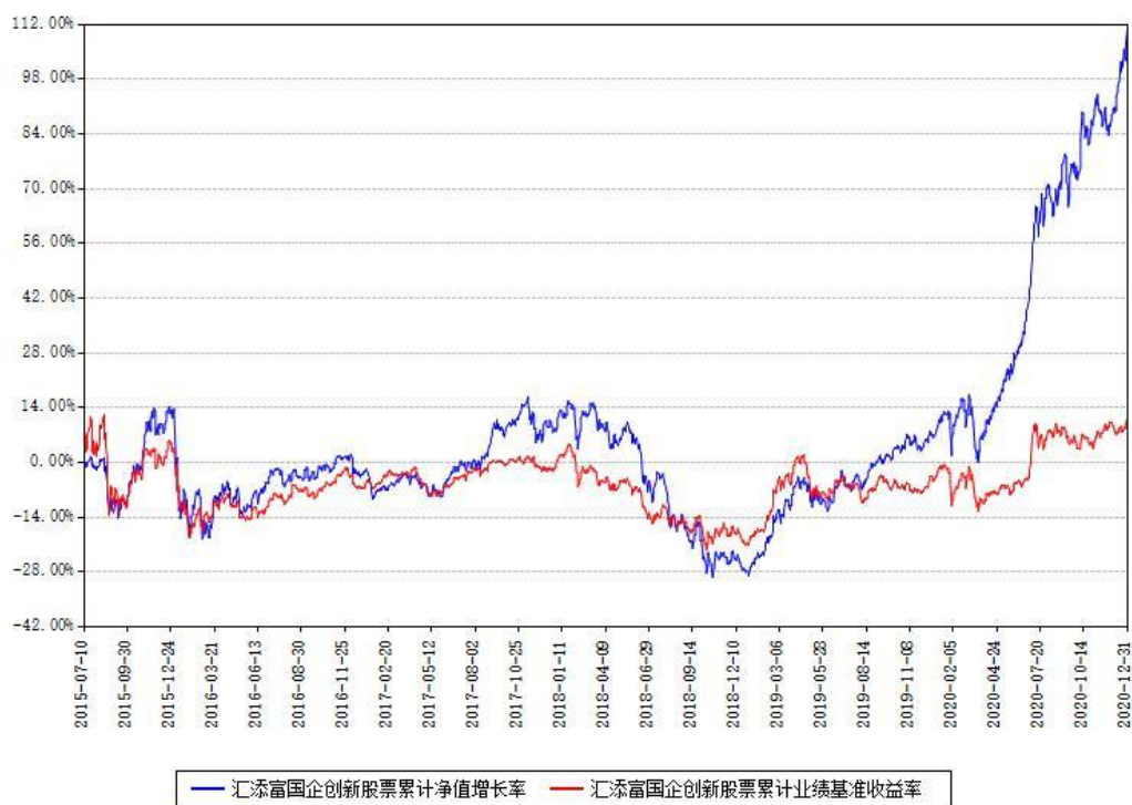
汇添富国企创新股票累计净值增长率与同期业绩基准收益率对比图

注：本基金建仓期为本《基金合同》生效之日（2015年07月10日）起6个月，建仓期结束时各项资产配置比例符合合同约定。