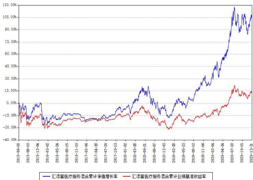
汇添富医疗服务混合累计净值增长率与同期业绩比较基准收益率对比图

注：本基金建仓期为本《基金合同》生效之日（2015年06月18日）起6个月，建仓期结束时各项资产配置比例符合合同约定。