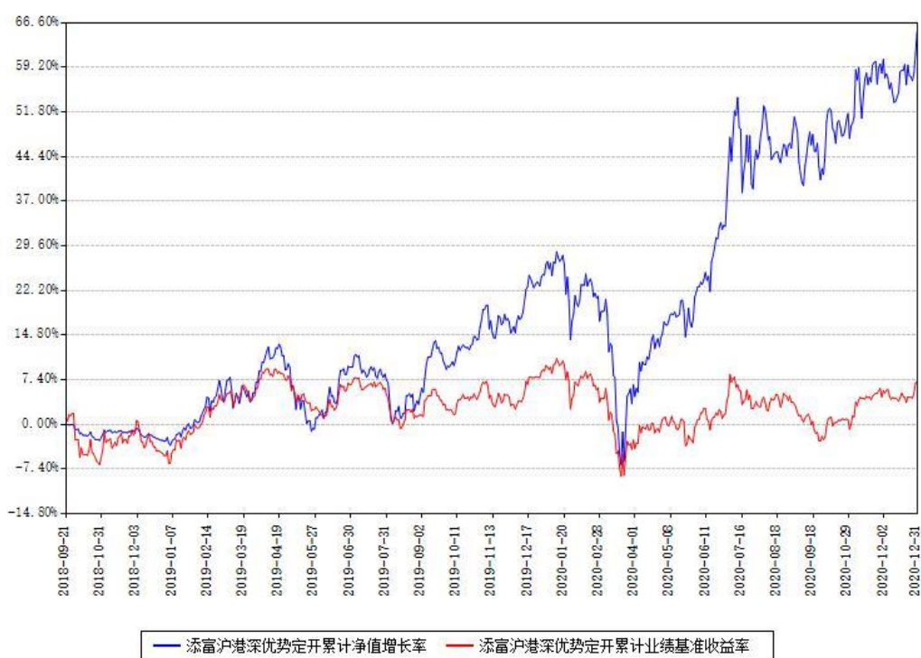
添富沪港深优势定开累计净值增长率与同期业绩基准收益率对比图

注：本基金建仓期为本《基金合同》生效之日（2018年09月21日）起6个月，建仓期结束时各项资产配置比例符合合同约定。