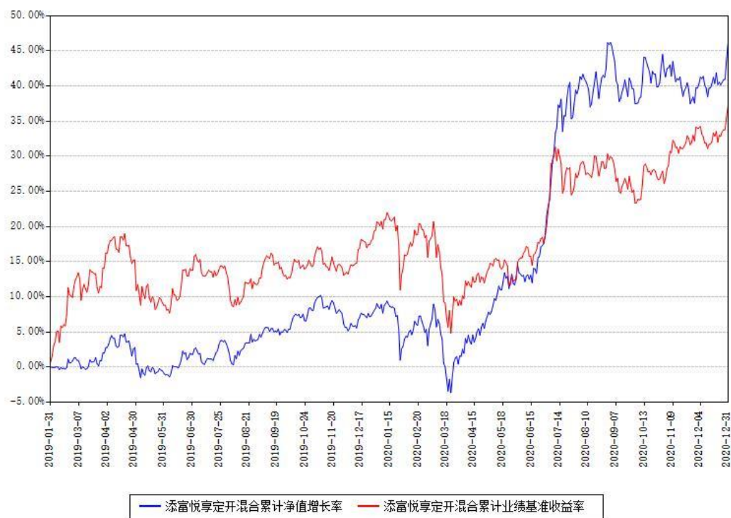
添富悦享定开混合累计净值增长率与同期业绩基准收益率对比图

注：本基金建仓期为本《基金合同》生效之日（2019年01月31日）起6个月，建仓期结束时各项资产配置比例符合合同约定。