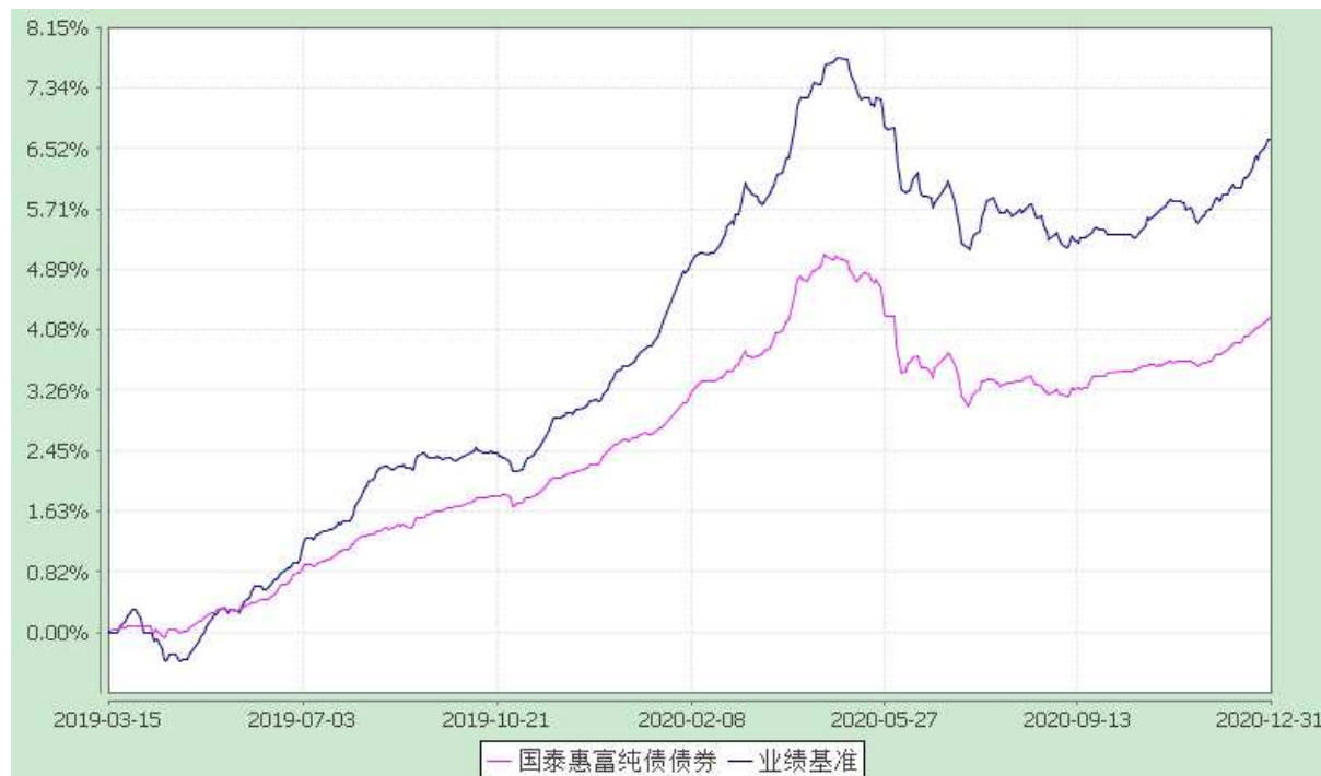
自基金合同生效以来份额累计净值增长率与业绩比较基准收益率的历史走势对比图 (2019 年 3 月 15 日至 2020 年 12 月 31 日)

注：本基金合同生效日为 2019 年 3 月 15 日，本基金在 6 个月建仓期结束时，各项资产配置比例符合合同约定。