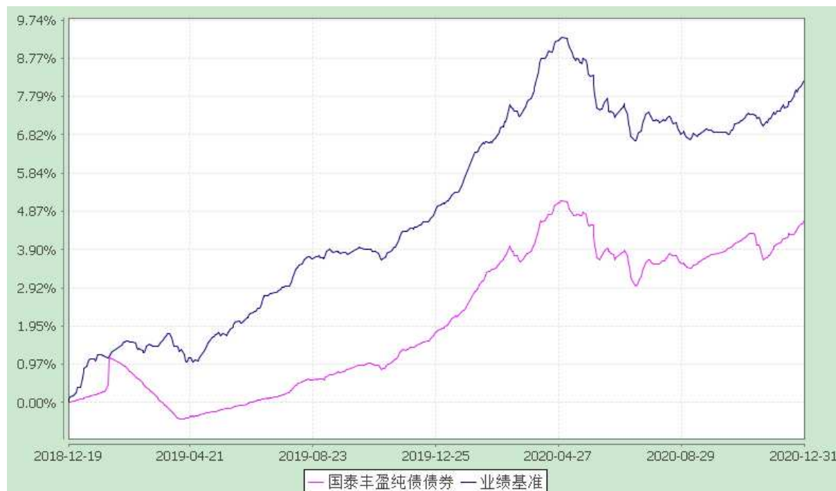
自基金合同生效以来份额累计净值增长率与业绩比较基准收益率的历史走势对比图 (2018 年 12 月 19 日至 2020 年 12 月 31 日)

注：本基金合同生效日为 2018 年 12 月 19 日。本基金在 6 个月建仓期结束时，各项资产配置比例符合合同约定。