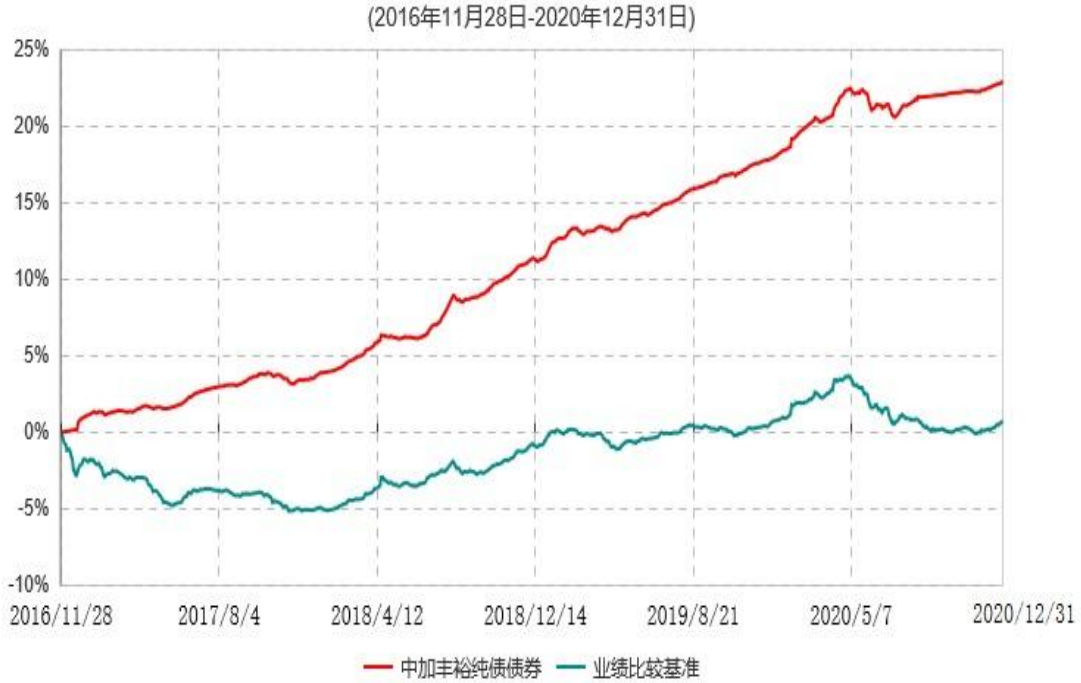
中加丰裕纯债债券型证券投资基金累计净值增长率与业绩比较基准收益率历史走势对比图