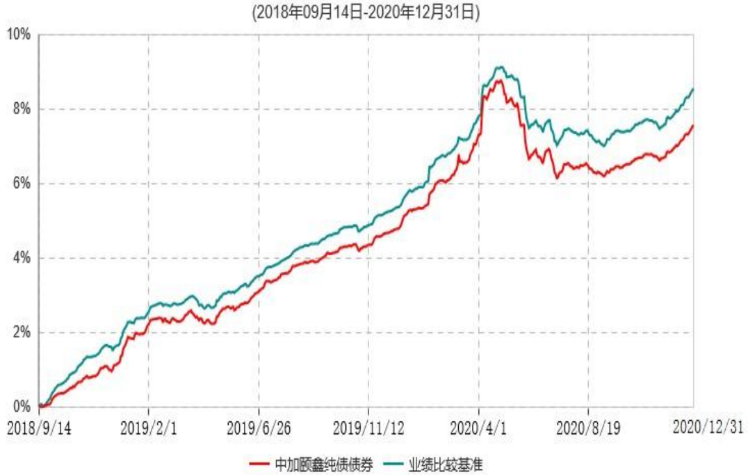
中加颐鑫纯债债券型证券投资基金累计净值增长率与业绩比较基准收益率历史走势对比图